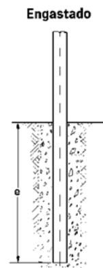
SISTEMA DE FIXAÇÃO