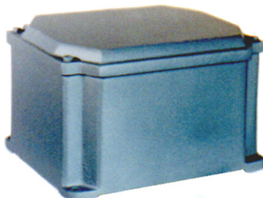
TU – R 14