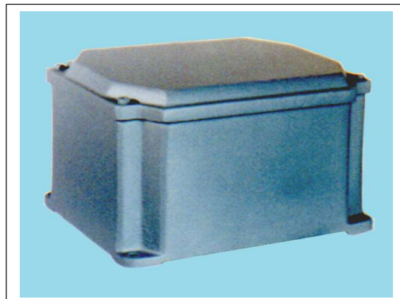
TU – R 14